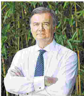
AGOSTINO REBAUDENGO PRESIDENTE ELETTRICITÀ FUTURA

Servono una riforma dei processi organizzativi e una programmazione energetica