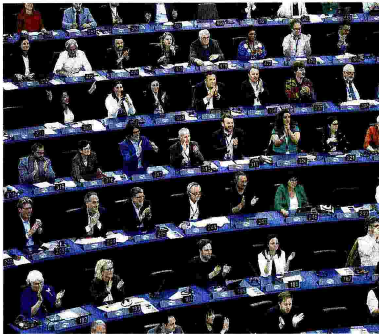
Strasburgo. Gli europarlamentari applaudono dopo il voto sulle emissioni