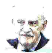
GIAN CARLO BLANGIARDO Da febbraio 2019 è presidente dell'Istat

SERVE FARE COMUNITÀ «Per il benessere dei cittadini occorre realizzare più spazi di socializzazione»