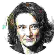
ELENA BONETTI Ministro per le pari opportunità e la famiglia