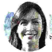
MARA CARFAGNA Ministro per il Sud e coesione territoriale

SUPERARE IL GAP DI GENERE «Certificazione di parità salariale per Pmi con più di 15 addetti che lavorano nel Piano»