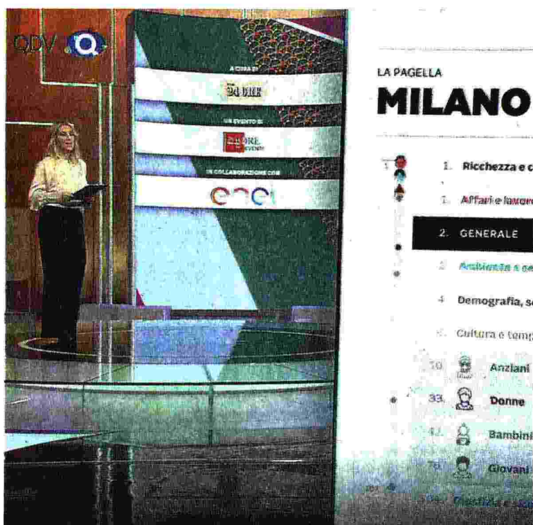
In diretta. L'evento «Ricucire le città» trasmesso sul sito del Sole 24 Ore e su Sky

aggiungono gli utenti Sky. Sempre sul sito del Sole 24 Ore è possibile consultare le classifiche con interrogazioni interattive qualitadellavita.ilssole24ore.com