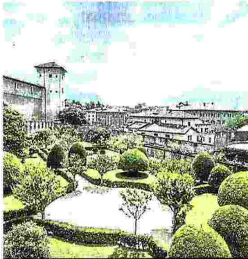
1° CLASSIFICA GENERALE TRENTO