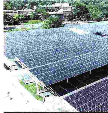
1° SOLARE EDIFICI PUBBLICI PADOVA

Giacomo Bagnasco — a pag. 10 e 11 con le graduatorie di Legambiente per i capoluoghi in 18 indicatori