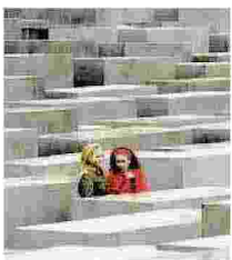
BERLINO Il Memoriale di Peter Eisenman