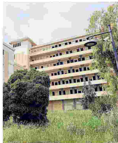
▲ Eterna incompiuta L'ex Onig di via Ingegneros, a Palermo

Il ministero elenca le opere ferme Ci sono strade pensate negli anni '80 e dighe ideate nel Dopoguerra