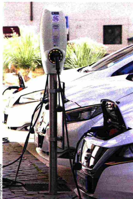
Per il passaggio a vetture elettriche sono stati previsti 20 milioni di euro. Ma poi non è stata stabilita la modalità per erogarli.

E magari, già che ci siamo, si potrebbe riprendere in mano anche il «piano nazionale di interventi di efficientamento energetico degli edifici pubblici adibiti a uso scolastico». Pure questa è una storia piuttosto curiosa. La norma risale al dicembre 2019 ma, nonostante i 40 milioni stanziati, nulla è avvenuto nel corso di un anno. Questa volta, però, la fiamma della speranza resta accesa: non è stata prevista alcuna scadenza temporale al provvedimento attuativo che ancora manca. Cingolani, se vuole, può partire (anche) da qui. ■