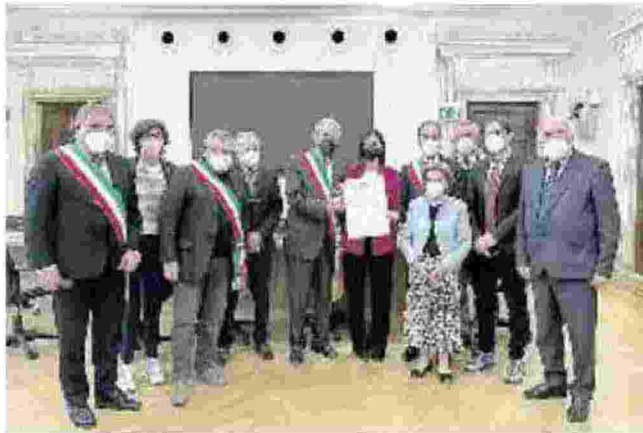
La ministra Mara Carfagna con i sindaci delle isole minori