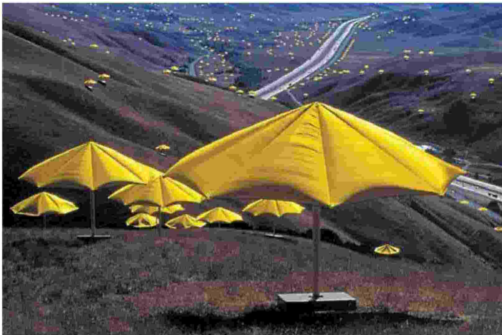
Un'opera di Christo e Jeanne-Claude