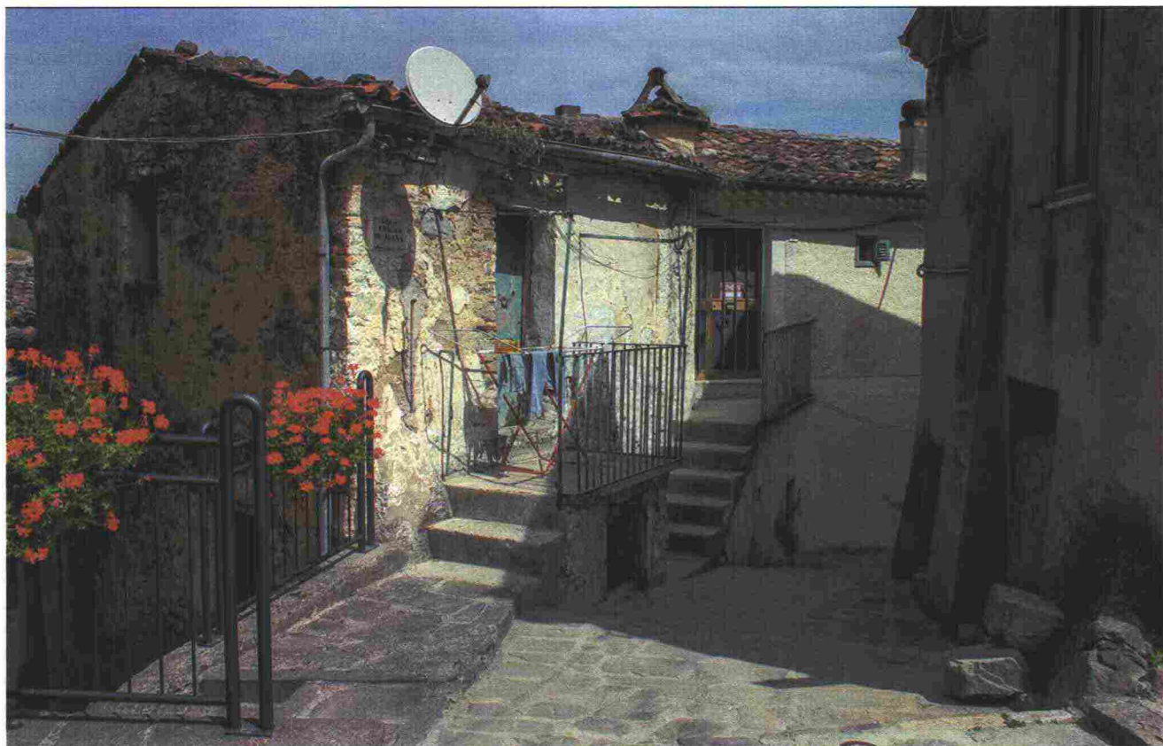
Tra i vicoli di Calvello, borgo arroccato sulle montagne della Basilicata, in provincia di Potenza

→ nei giovani a scegliere di tornare "giù" per lavorare (l'85 per cento, secondo Svimez, vorrebbe continuare a svolgere il proprio impiego da casa) ha innescato una miccia che in alcuni comuni si è tradotta con l'introduzione di benefici per evitare lo spopolamento, considerando che ai primi posti per emigrazione all'estero o al Nord ci sono le province della Sicilia e della Calabria. Proprio in quest'ultima regione Giampietro Coppola, sindaco di Altomonte, nel cosentino, ha pensato a dei benefici per coloro che tornano a casa e ha creato un bando per riportare i giovani nei borghi. Tra gli 800 e i mille euro per tre anni agli under 40 che decidono di intraprendere un'attività commerciale in una decina di paesi sotto i 2mila abitanti.