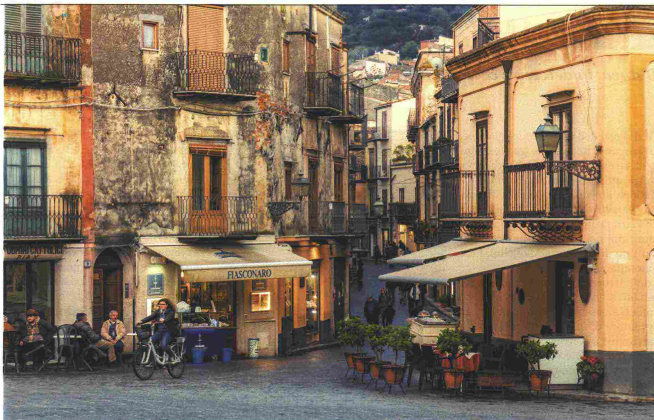
Uno scorcio di Castelbuono, cittadina delle Madonie in provincia di Palermo