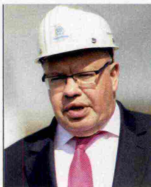
Il ministro dell'Economia tedesco Peter Altmaier. In alto: impianto di idrogeno del gruppo Linde a Leuna, in Sassonia. La Linde è specializzata nel settore dei gas tecnici e ora punta sull'energia dall'idrogeno

Non sarà un gioco individuale: le mosse di ogni Stato andranno concordate con il resto d'Europa se il Continente vorrà rimanere