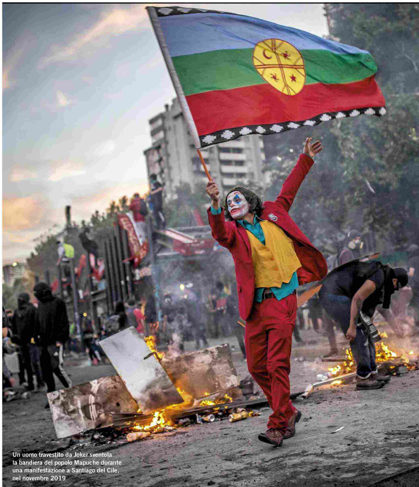
Un uomo travestito da Joker sventola la bandiera del popolo Mapuche durante una manifestazione a Santiago del Cile, nel novembre 2019