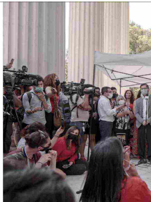
Un membro dell'Assemblea costituente durante la prima sessione per redigere la nuova Costituzione cilena