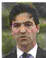
Presidente Francesco Acquaroli, 47 anni, governatore delle Marche