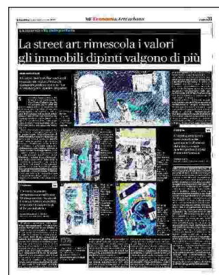
5 "Santa Maria di Shanghai" dell'artista italiano MR Klevra nel quartiere Tor Marancia a Roma, il murale fa parte del progetto "Big City Life Tor Marancia"