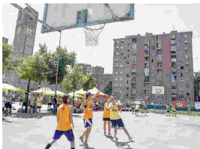
Qui Torino Il capoluogo piemontese beneficerà di 18 milioni di euro. L'amministrazione comunale, col progetto «AxTo» ha scelto di privilegiare interventi diffusi in 5 ambiti: spazio pubblico, casa, lavoro e innovazione, cultura e scuola, comunità e partecipazione. «Il budget salirà poi a 41 milioni grazie a investimenti privati», ha spiegato Appendino.