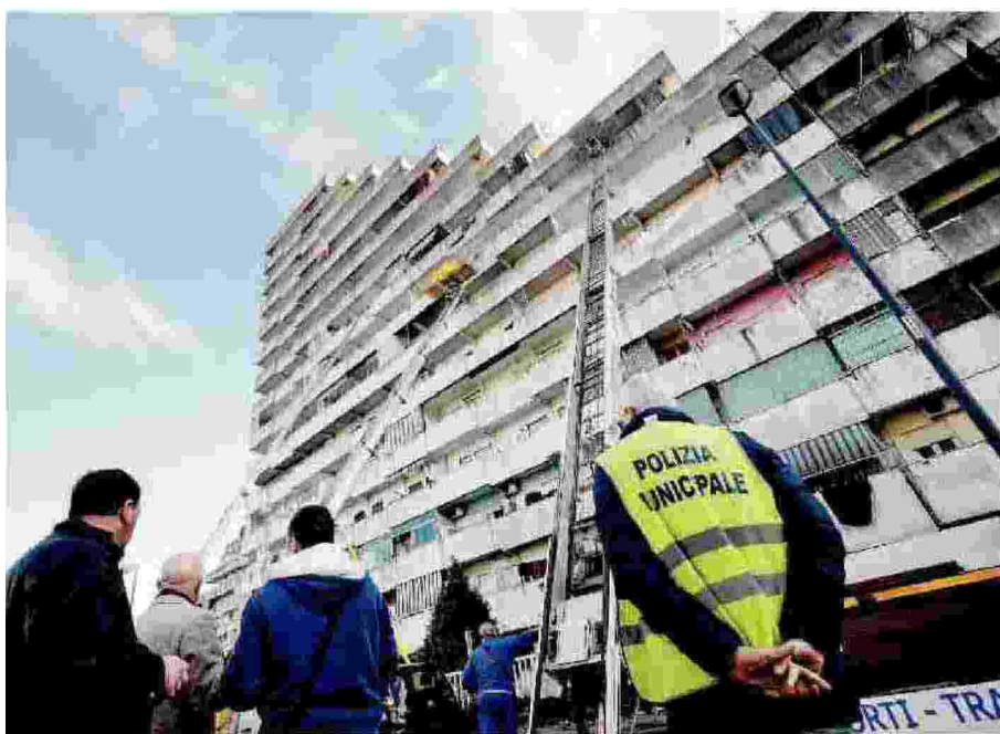
Qui Napoli Nel capoluogo campano cambierà il volto del quartiere di Scampia con l'abbattimento di tre delle quattro vele (rese celebri dalla serie tv «Gomorra»). Si tratta degli edifici A, C e D, mentre la vela B sarà riqualificata. L'intervento riguarderà anche gli spazi aperti