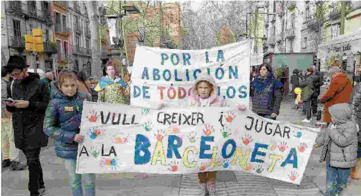
«Io voglio crescere e giocare»: i bambini sfilano a Barcellona durante la protesta contro gli alberghi in centro