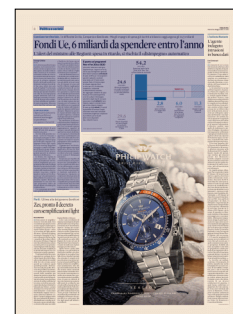
Peso: 1-1%, 8-32%

L'Agenzia per la Coesione ha avviato le verifiche sul sistema di monitoraggio: le spese effettive non appaiono in banca dati