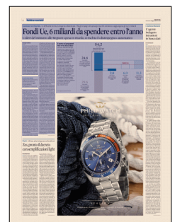
Peso: 1-1%, 8-32%