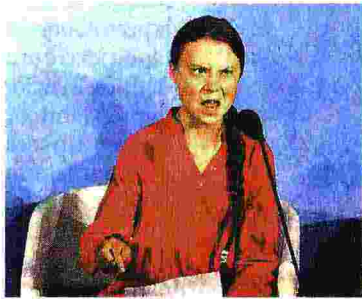
L'attacco. Greta Thunberg ieri all'Onu

Per 65 Paesi e per la Ue obiettivo zero emissioni entro il 2050