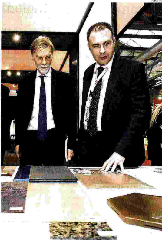
In fiera. Il ministro per le Infrastrutture Graziano Delrio (sinistra) e il presidente di FederlegnoArredo Emanuele Orsini all'apertura di Made Expo

Il ministro Delrio: quest'anno incentivati lavori per oltre 29 miliardi Snaidero (Made Expo): stiamo uscendo dalla crisi