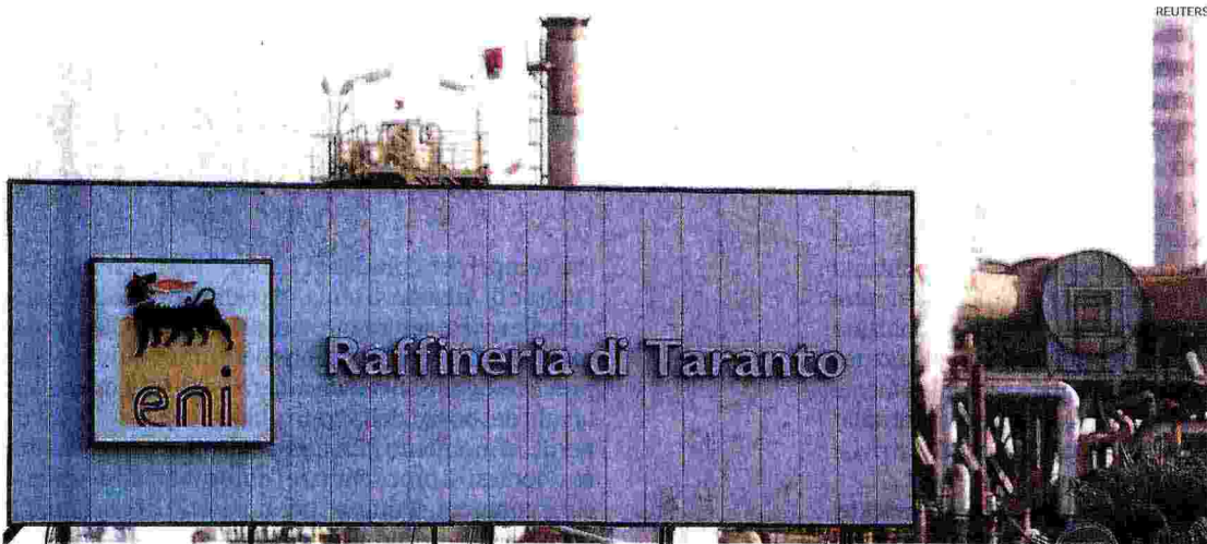
Raffineria Eni. L'ingresso dello stabilimento della compagnia petrolifera presente a Taranto