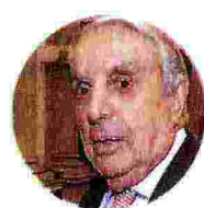
EMILIO RIVA (1926-2014)

Pioniere della siderurgia italiana, nei primi anni '50 fonda la società Riva & C.