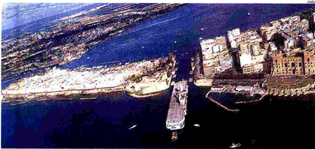
I due mari. La portaerei Cavour attraversa il ponte girevole per entrare nel Mar Piccolo e raggiungere l'Arsenale militare