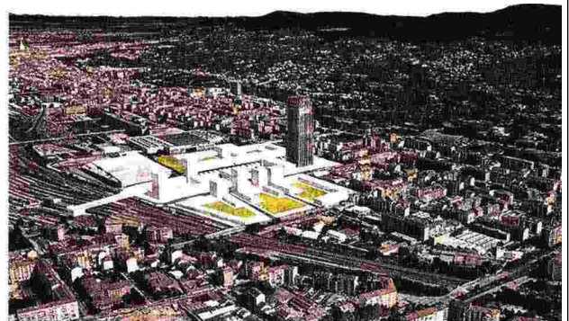
Masterplan. Il rendering del progetto per il nuovo Parco della Salute a Torino