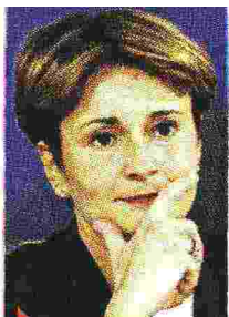
MINISTRO Federica Guidi responsabile del ministero dello Sviluppo economico