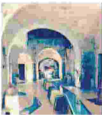
LA LAMARQUE L'ex conceria di Maglie è un museo e spazio aperto alla cultura