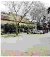
L'EX FADDA L'azienda vinicola riconvertita in polo di aggregazione