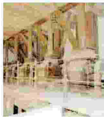
MOLINO SCOPPETTA A Pulsano l'antico molino che risale al 1911 conserva le sue macchine