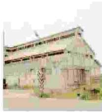
MAGAZZINO NERVI A Margherita di Savoia l'opera del noto architetto