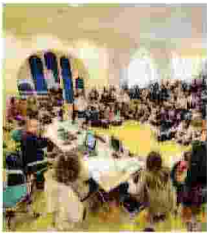
L'EX MACELLO A Bari ospita la Cittadella della cultura