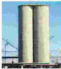
SILOS DEL PORTO Attendono il recupero i silos granari di Bari