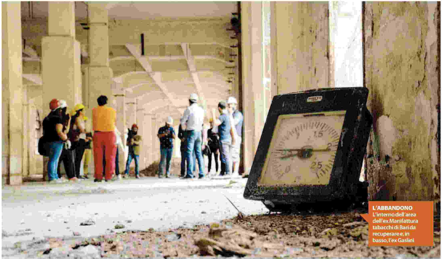
L'ABBANDONO L'interno dell'area dell'ex Manifattura tabacchi di Bari da recuperare e, in basso, l'ex Gaslini

Dall'ex Gaslini ai silos del porto di Bari fino al magazzino del sale di Margherita e ai capolavori del Salento. È lungo l'elenco dei beni da salvare. Ma ora c'è un ddl della Regione per catalogarli e riqualificarli