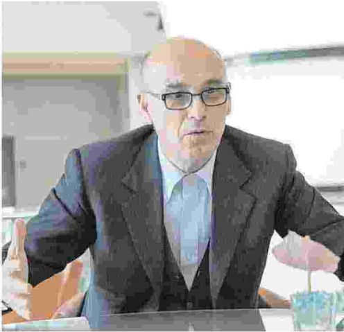
Renato Soru, Pd, ex governatore e padre del Ppr