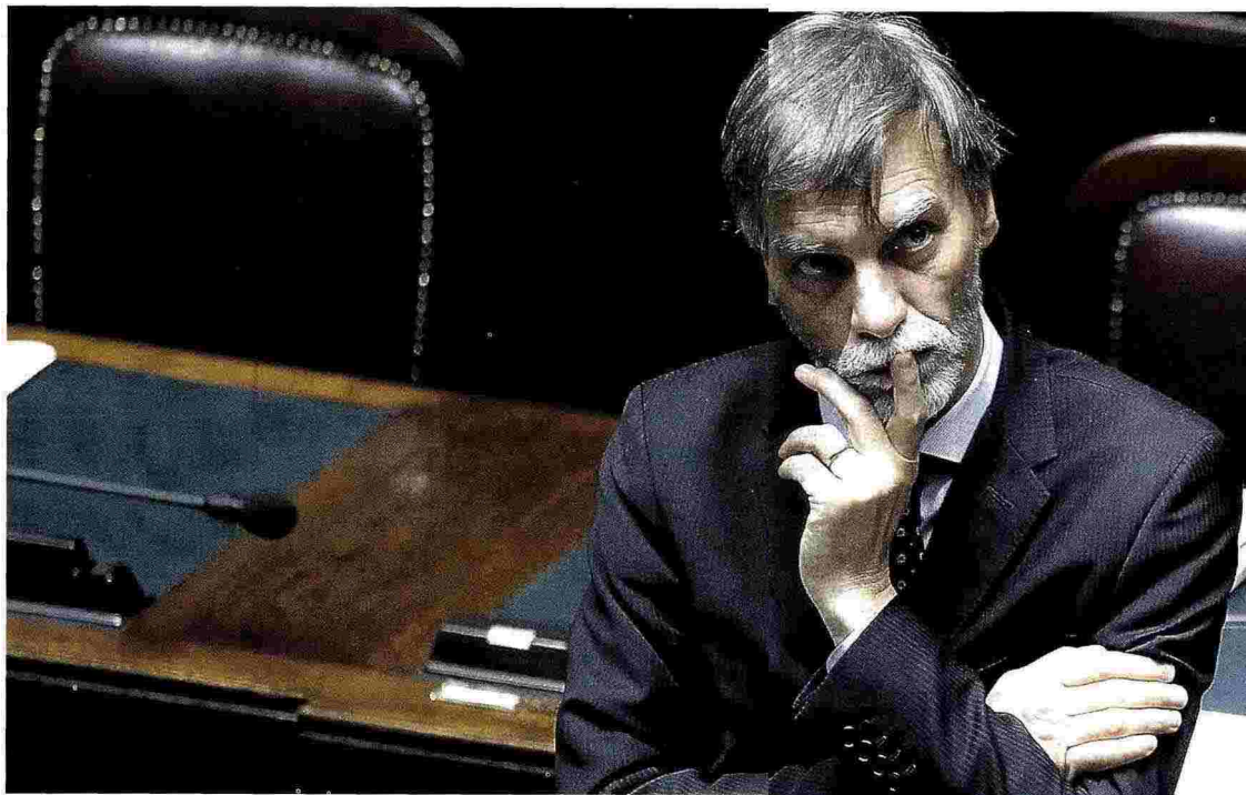
Graziano Delrio, sottosegretario alla presidenza del Consiglio