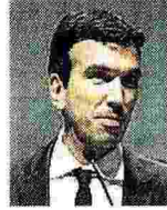
Ministro Maurizio Martina è alla guida delle Politiche agricole

Immaginare il futuro Niente progetti faraonici, servono idee ambiziose: così diventeremo leader per le tecnologie umane