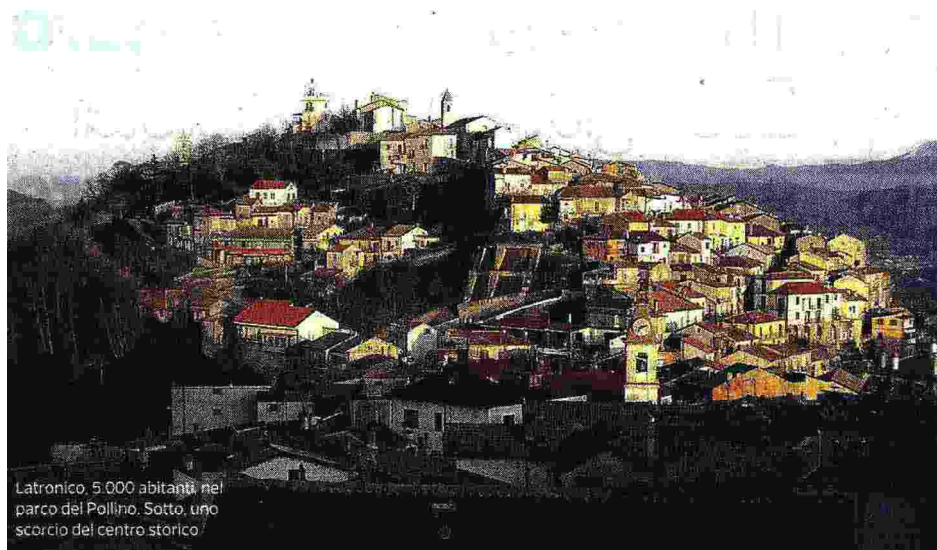
Latronico, 5.000 abitanti, nel parco del Pollino. Sotto, uno scorcio del centro storico