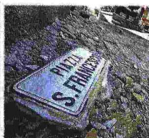
Campanile ristrutturato e crollato Oltre alla procura reatina, anche l'Anac avvierà una ricognizione sugli appalti per le ristrutturazioni di edifici pubblici degli ultimi anni: tra questi quelli riguardanti il campanile della chiesa di San Francesco ad Accumoli (nella foto a sinistra), il cui crollo ha provocato la morte di un'intera famiglia