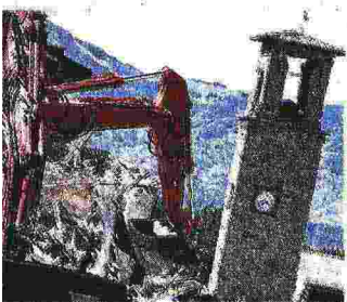
La Torre lesionata e l'orologio È uno dei simboli del sisma del 24 agosto: la torre civica di Amatrice (foto a sinistra) con le lancette dell'orologio ferme all'ora della scossa (3,36). Ma è anche uno degli edifici storici fortemente danneggiati (insieme alla Chiesa di Sant'Agostino del XV secolo) di cui ora si teme il crollo