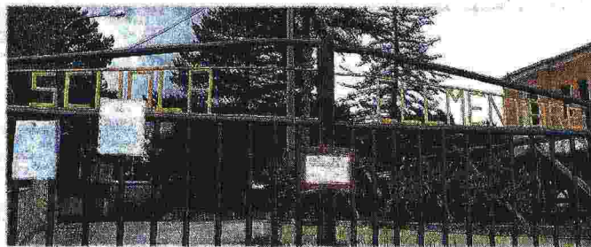
Edifici crollati, al via i sequestri Il procuratore capo di Rieti, Giuseppe Saieva, disporrà numerosi sequestri di edifici crollati o danneggiati nel cratere del sisma: tra questi la scuola Romolo Capranica di Amatrice (nella foto a sinistra) gravemente lesionata. Era stata ristrutturata nel 2012