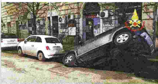
Monteverde, 13 marzo Nella notte un'auto parcheggiata sprofonda