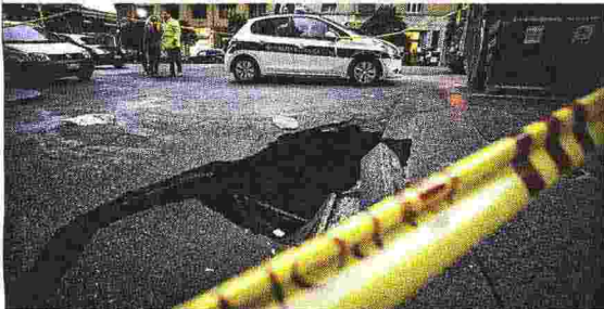
Piazza Bologna, 15 gennaio L'asfalto inghiotte un'anziana che passeggia