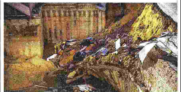
Balduina, 14 febbraio Sette auto nel vuoto e due palazzi evacuati

1.135 Gli ettari della città interessati dal pericolo alluvione, in cui vivono 250mila persone: è l'esposizione più alta d'Europa