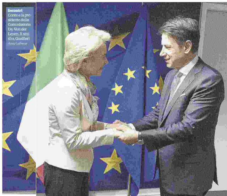
Incontri Conte e la presidente della Commissione Ue, Von der Leyen. A sinistra, Gualtieri

Il documento M5S Patuanelli e Fraccaro indicano la via per gli interventi da portare in Unione