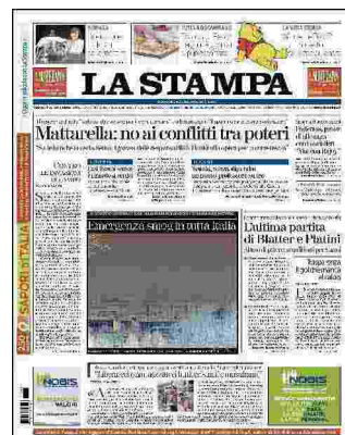
Milano: la zona di Porta Nuova immersa nello smog di questi giorni