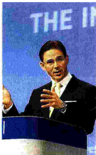
Commissario. Jyrki Katainen