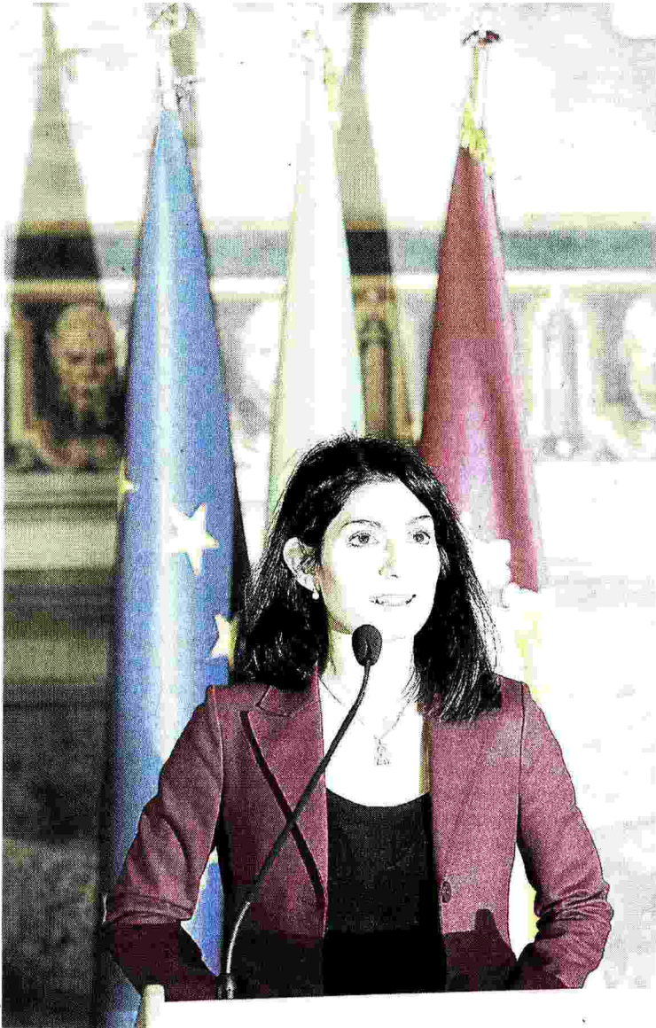
Virginia Raggi