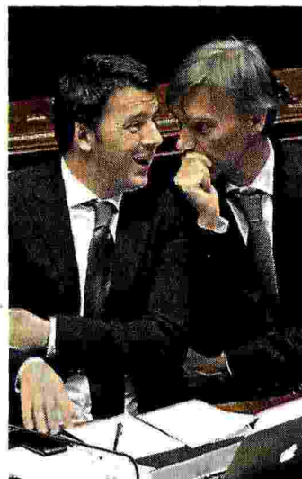
Renzi e Delrio

IL PREMIER INSISTE CON L'EUROPA PER TOGLIERE LE SPESE INFRASTRUTTURALI DAL CONTO DEL DEFICIT