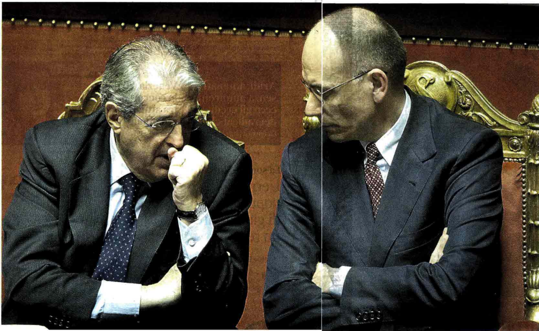
CONTI PUBBLICI Il ministro dell'economia Fabrizio Saccomanni e il premier Enrico Letta hanno presentato in Parlamento le strategie del governo