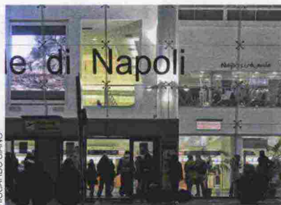
IN ALTO, PIAZZA DEL PLEBISCITO OGGI E A DESTRA IL LUNGOMARE SENZA PIÙ AUTO. QUI SOPRA L'AEROPORTO PREMIATO COME MIGLIORE D'EUROPA NELLA CATEGORIA 5-10 MILIONI DI PASSEGGIERI