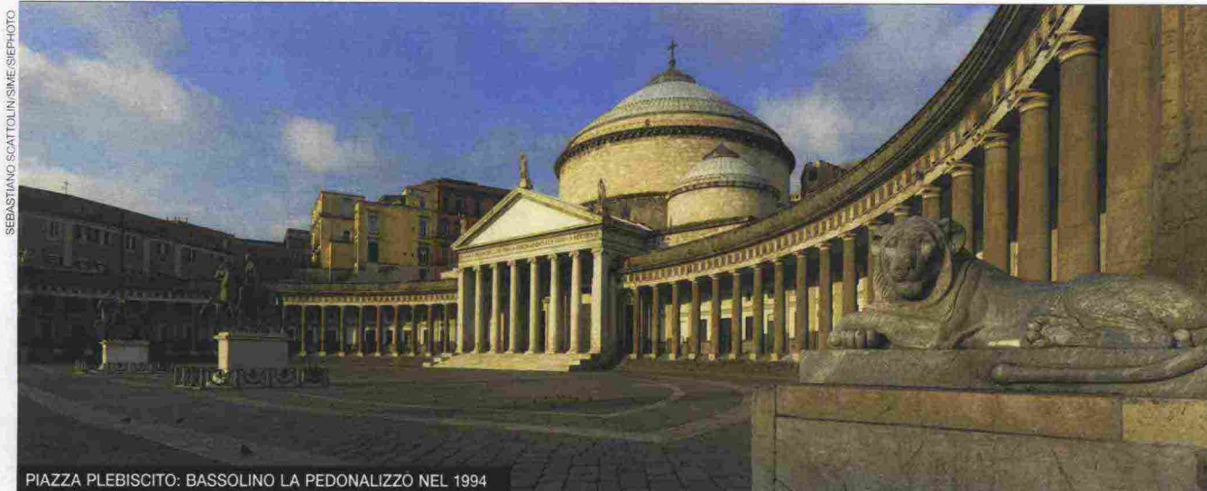
PIAZZA PLEBISCITO: BASSOLINO LA PEDONALIZZO NEL 1994

poterci dire non più un peso per il Paese ma un'opportunità. C'è più città disposta a credere nel suo futuro. I professionisti non si vergognano di candidare Napoli a sede dei congressi di categoria».