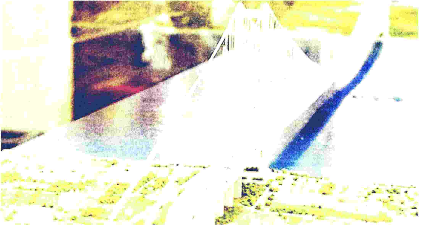
Stretto. Il rendering del ponte

Ritaglio stampa ad uso esclusivo del destinatario, non riproducibile.