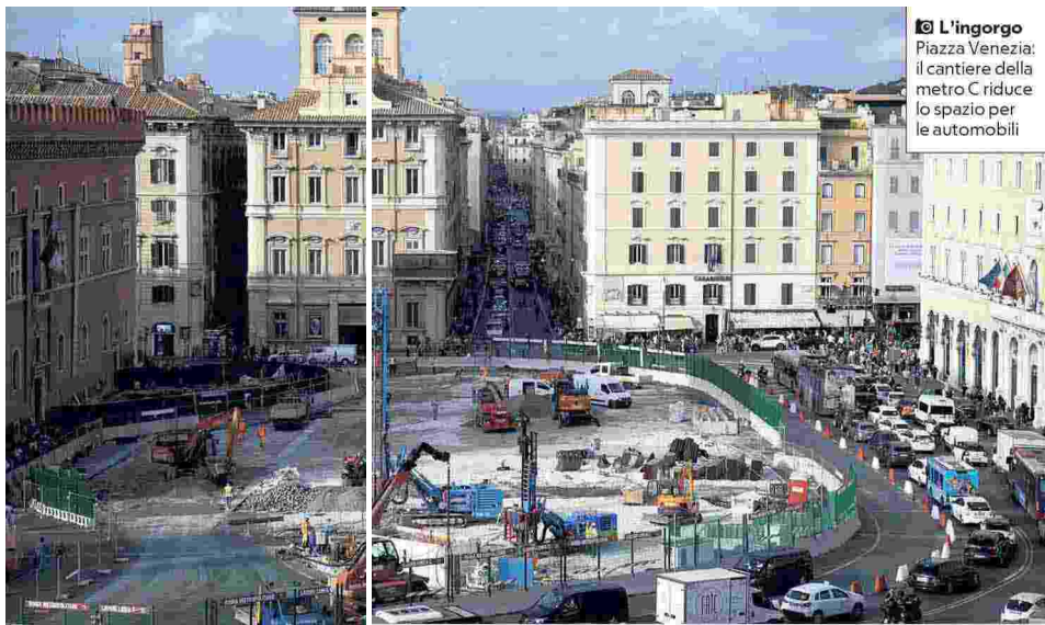
L'ingorgo Piazza Venezia: il cantiere della metro C riduce lo spazio per le automobili