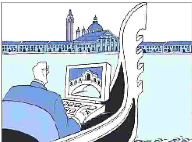
ILLUSTRAZIONE DI DORIANO SOLINAS