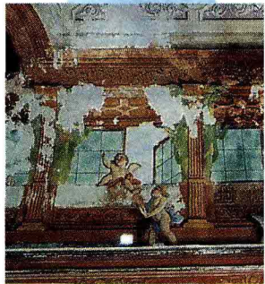
L'affresco Sono rimasti a malapena i putti, tra finestre cancellate