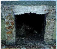
Il caminetto Via i marmi, completamente distrutto