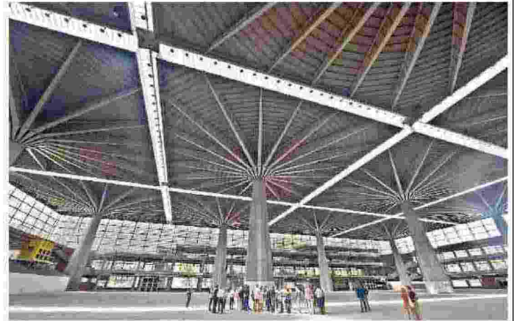
Palazzo del lavoro a Torino: progettato da Nervi per Italia '61, il Pd vuole farne un centro commerciale