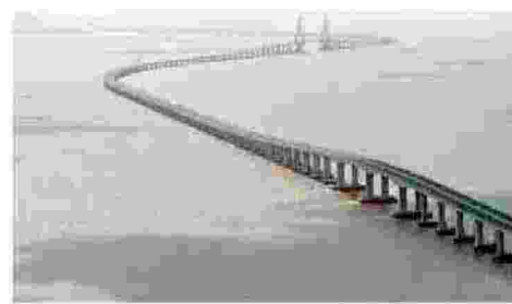
Un ponte fra Hong Kong e Macao I piloni in mezzo al mare vengono posati da Trevi