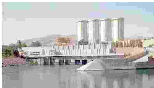
La diga di Mosul nell'Iraq in guerra Trevi collabora alle opere di consolidamento