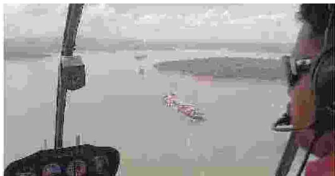
Unire l'Atlantico e il Pacifico È di Salini Impregilo il secondo Canale di Panama