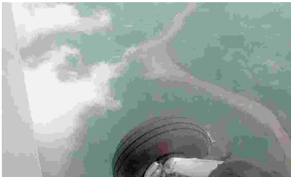
Il Nilo Azzurro visto dal piccolo aereo (il carrello non è retrattile) che fa la spola fra la capitale etiopica Addis Abeba e il cantiere della diga

Dimensioni faraoniche Nell'immagine una porzione della diga principale costruita al confine tra Etiopia e Sudan