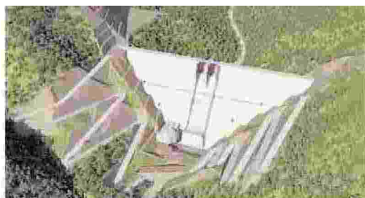
Elettricità per l'Indonesia Due dighe nel progetto Upper Cisokan di Astaldi