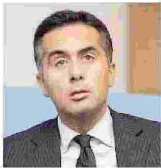
MASSIMILIANO SALINI EURODEPUTATO DI FORZA ITALIA