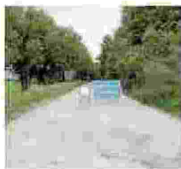
Trivento Salcito e Trivento sono isolate dal capoluogo Campobasso