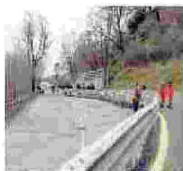
Gimigliano A rischio il collegamento tra Catanzaro e i monti in provincia