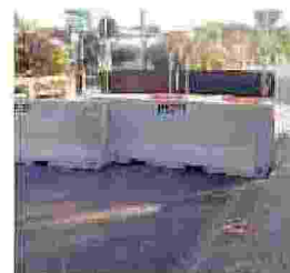
Terracina Via bloccata verso l'area turistica di San Felice Circeo