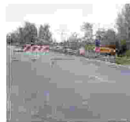
Colorno Gravi danni al trasporto merci tra Parma e Cremona