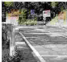
Imperia La chiusura della provinciale 100 ha isolato zona Monesi