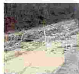
Rio Bavera Chiusura del ponte tra le province di Cuneo e Imperia