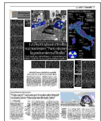
Le proteste Un flashmob contro il nucleare organizzato da Legambiente