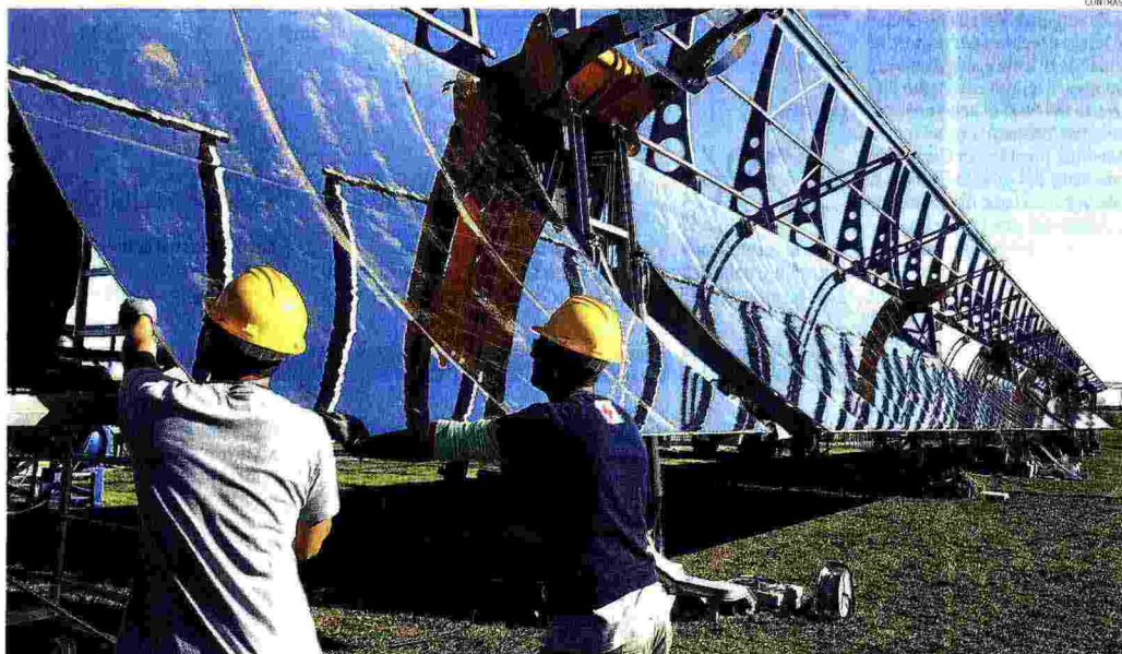
In dieci anni. La crescita delle fonti "pulite" ha portato il contributo rispetto ai consumi dal 15 al 35,5%

Impianti di accumulo abbinati a tecnologie smart grid efficientano la produzione elettrica da fonte fossile, Ventotene area laboratorio