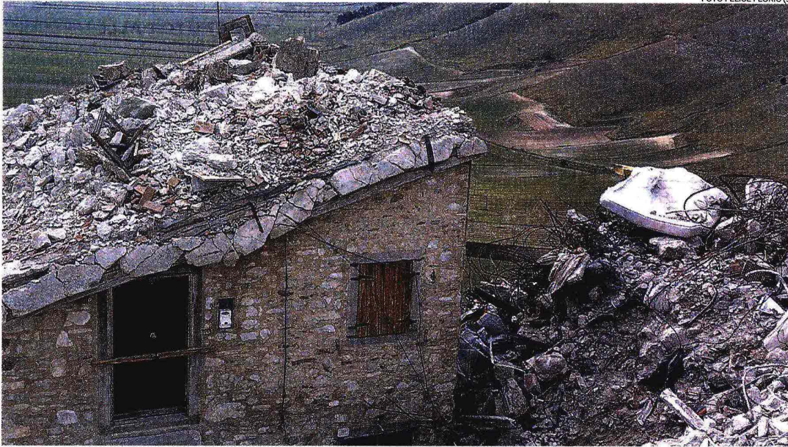
A Castelluccio. Un'abitazione distrutta con le macerie ancora da rimuovere a due anni dal sisma