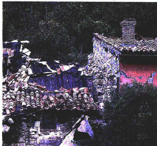
Territorio dimenticato. Sopra, nella foto grande: a Visso (Macerata) 49 casette hanno bisogno di lavori per la muffa e i residenti stanno uscendo dalle abitazioni. Sotto a sinistra: pezzi di cartongesso già rimossi dalle casette di Visso; a destra: casa distrutta a Castelsantangelo sul Nera (Macerata), dove tutto è bloccato a due anni fa