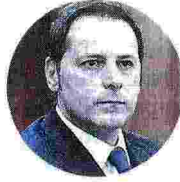
ARMANDO SIRI Il sottosegretario alle Infrastrutture lancia l'idea di un supercommissario nazionale

Solo in questo modo - dice Siri - «supereremo una sfiducia degli investitori italiani e stranieri, che sanno di non poter contare su risposte veloci e chiare. Partiamo dai lavori pubblici a cambiare un sistema che però riguarda anche le autorizzazioni per uno stabilimento industriale. Per non parlare della catena dei contenziosi dove un tribunale è capace di bloccare per venti anni un investimento».