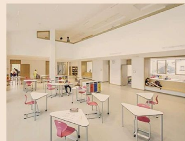
Quando la bella scuola è possibile. Alcune scuole innovative e sostenibili segnalate da Legambiente. Nella foto sopra: il polo scolastico di Collecchio (Parma), edificio a impatto zero. A destra dall'alto in senso orario: la scuola per l'infanzia «Pertini» di Bisceglie (Brindisi); il chiostro ristrutturato del liceo musicale di Lucca; le aule e gli esterni del nuovo polo di Trento (Bolzano)