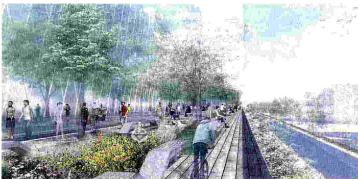
Il nuovo Portello / 1. Milano Alta avrà un percorso ciclopedonale (la «green line») di 1 km a 7 metri di altezza